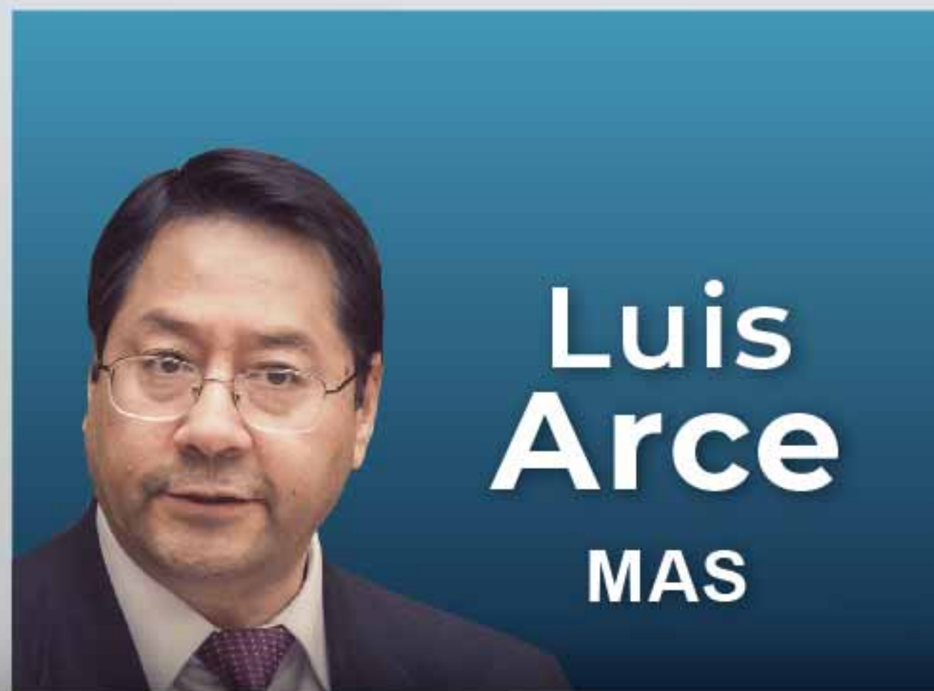
Luis Arce MAS