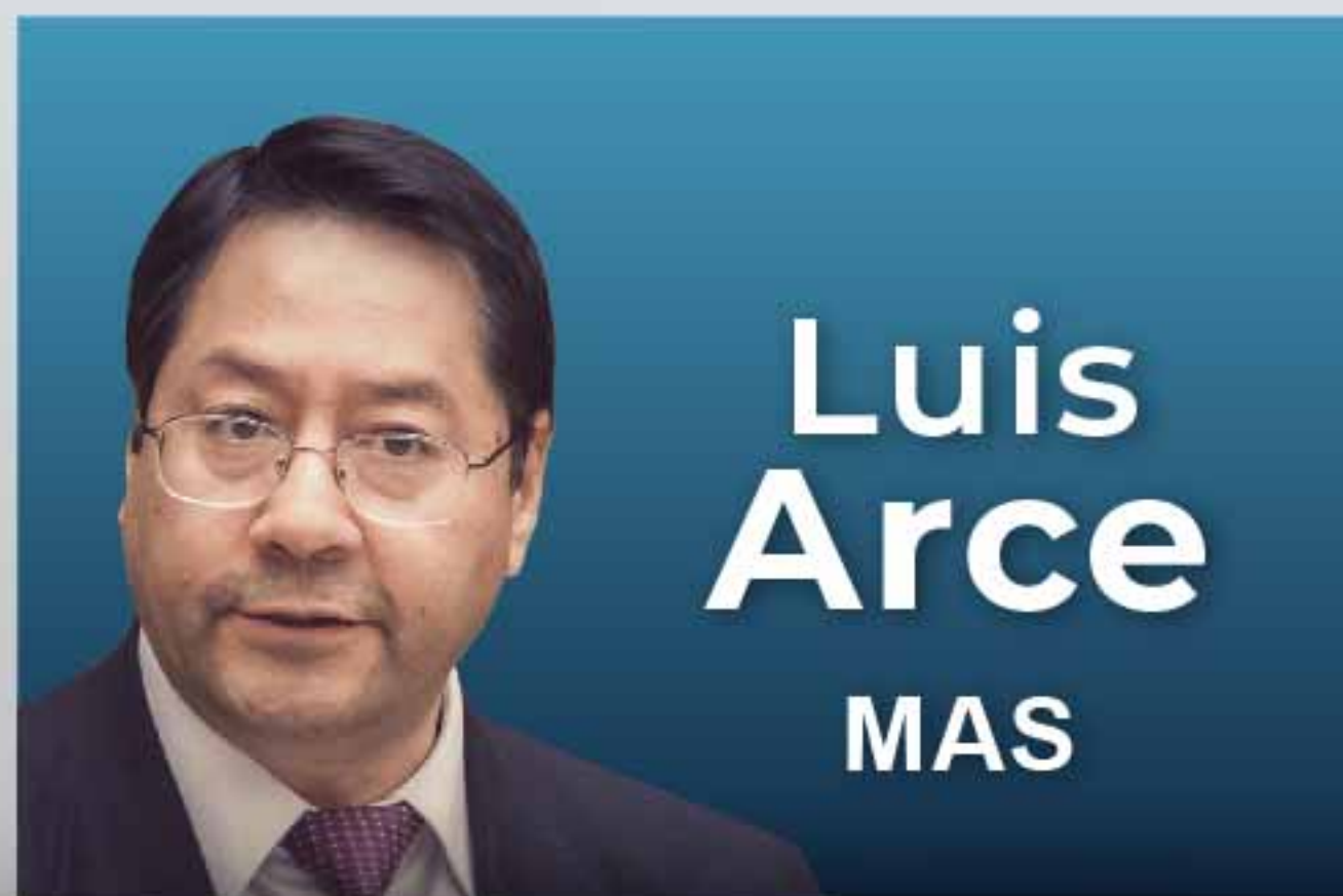
Luis Arce MAS