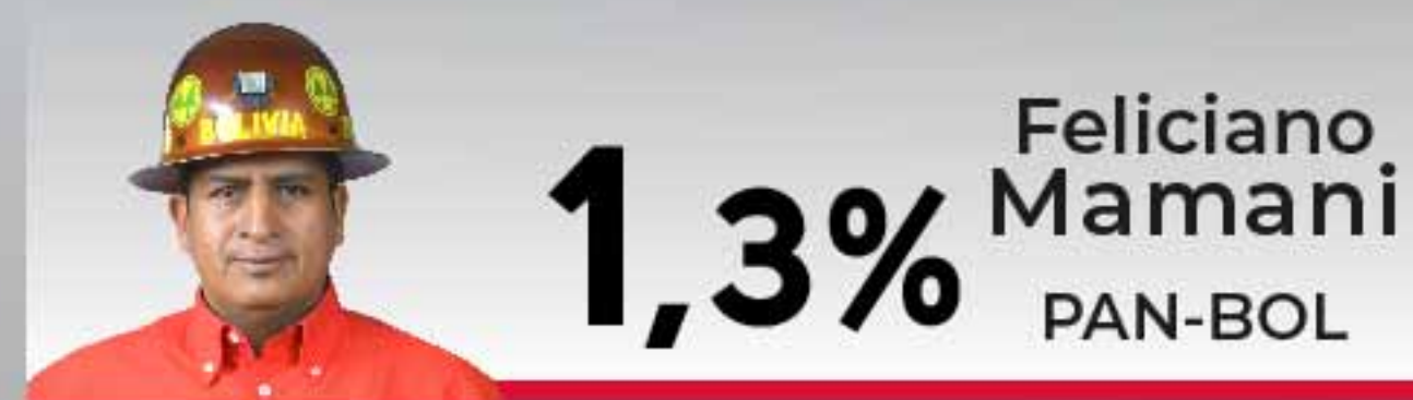
1,3% Feliciano Mamani PAN-BOL