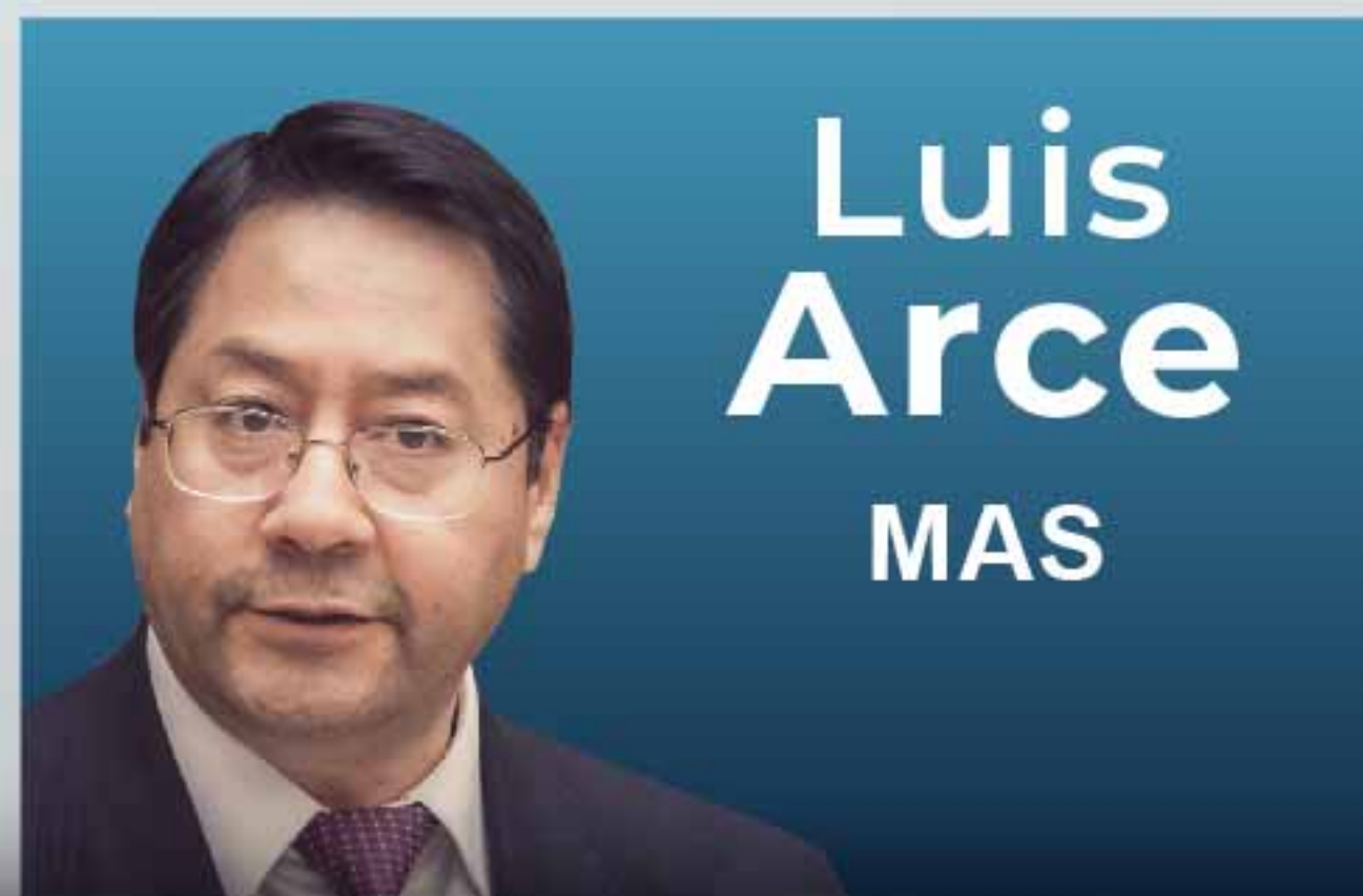
Luis Arce MAS