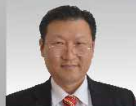
1,1% Chi Hyun C hung FPV