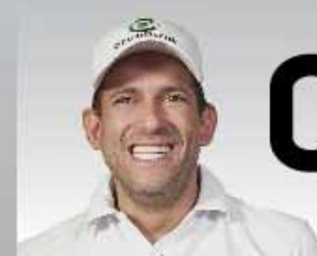
0,9% Luis F. Camacho CREEMOS