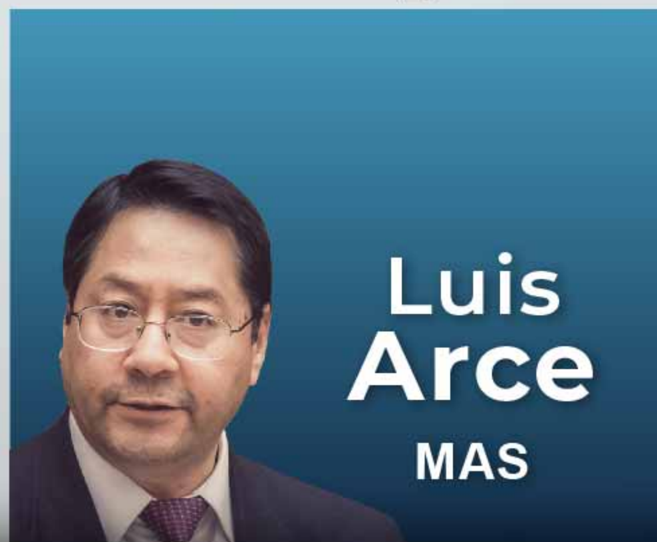
Luis Arce MAS