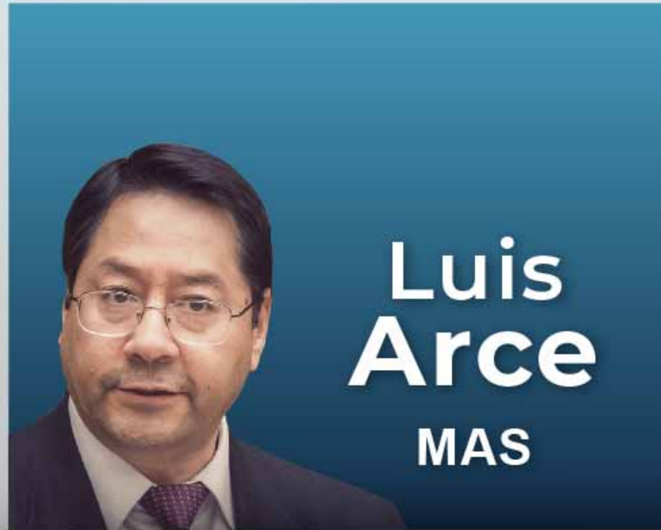
Luis Arce MAS