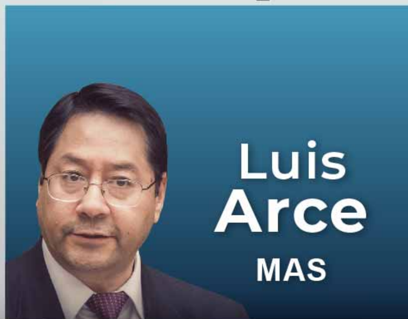
Luis Arce MAS