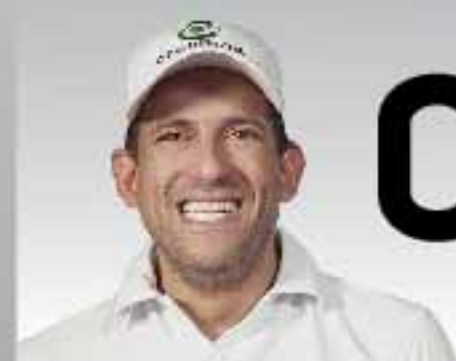
0,8% Luis F. Camacho CREEMOS