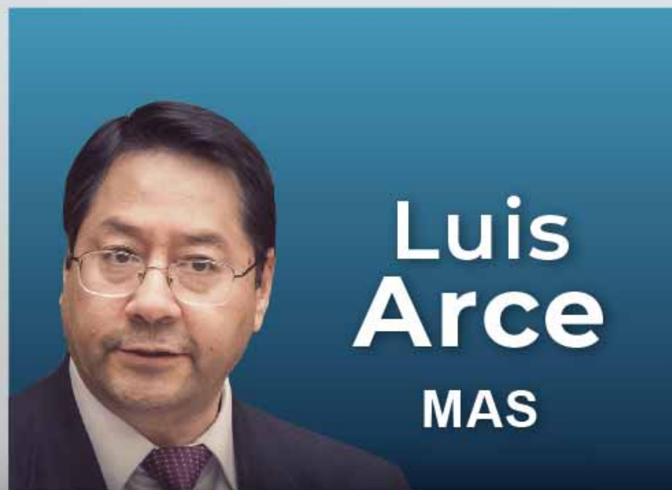
Luis Arce MAS