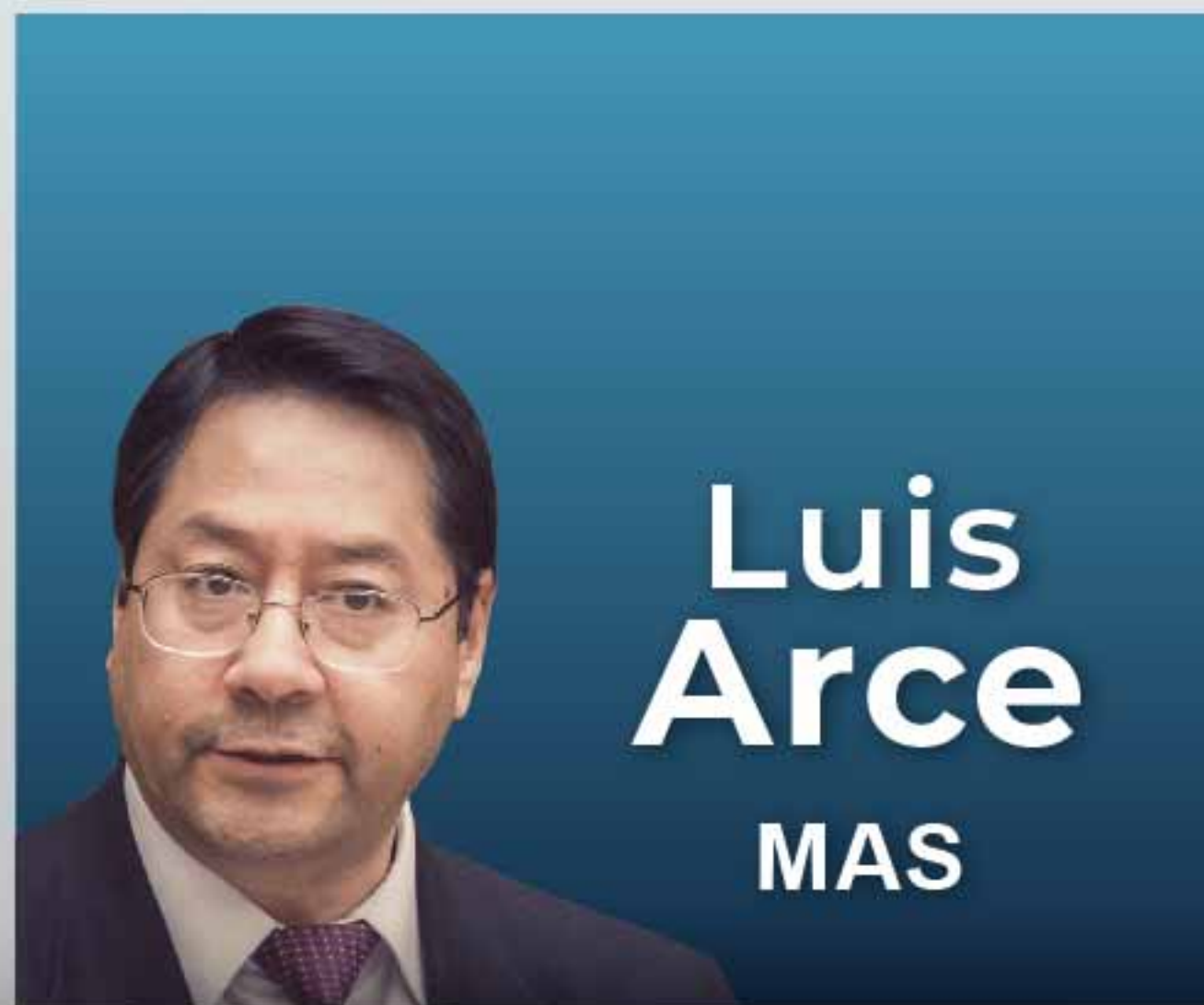
Luis Arce MAS